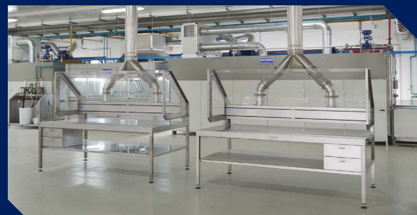
Table de tamponnage