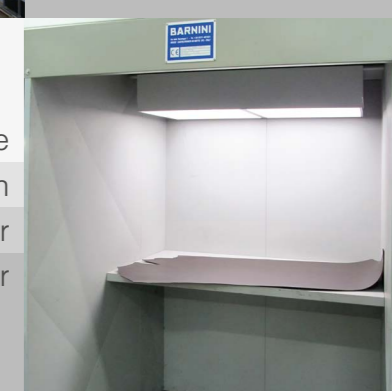
Cabine essai couleur