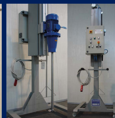
Sistema miscelazione Mixing system Sistema de mezclado Système de mélange